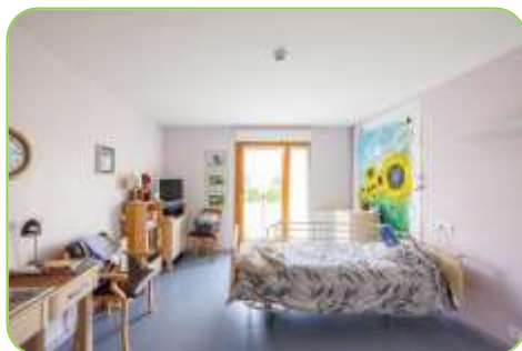
Résidence Les Charmilles

Vous disposerez d'une clé ou d'un badge pour sécuriser votre chambre.