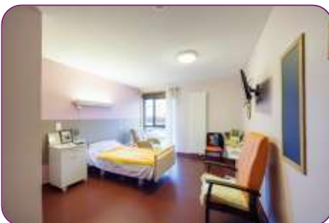
Résidence Le Jardin Des Vignes