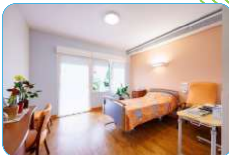
Résidence Les Rives De l'Arnon